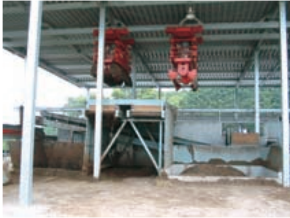
自動混合装置 (左が牛ふんピット、右がチップピット)