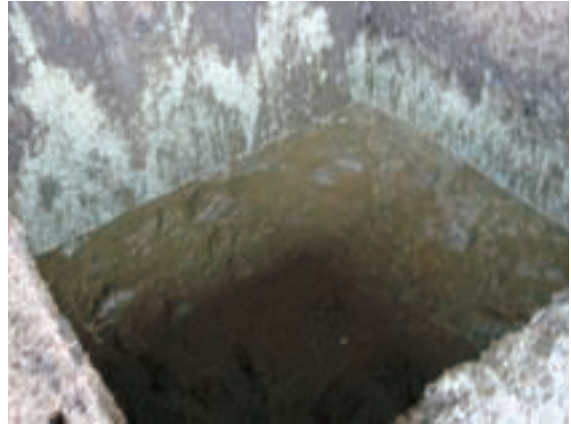
牛ふんピット (実際にはドロドロ状態で搬入されている)