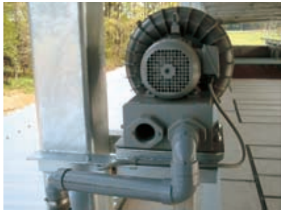
送風ブロー (送風配管は溝へ埋設し清掃を簡易化)