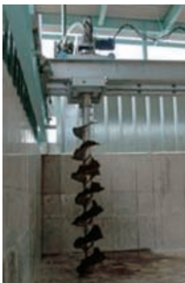
スクリーュージェッター全体のすがた