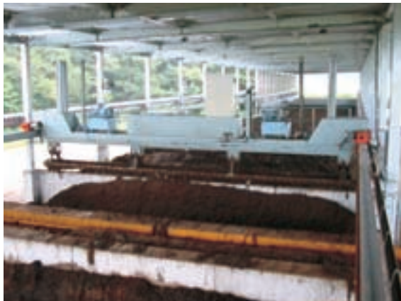
クレーン式発酵槽 (手前から奥へ1回/週の切り返し)