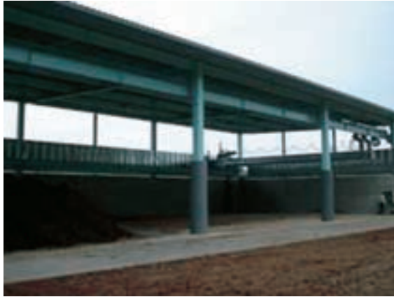
投入側 大型ローダー大型ダンプの出入口可能 高さ 5.6m 位まで開放