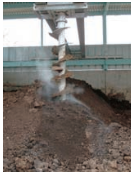
製品が 10mm 内外に粉碎されている