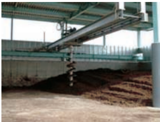
高さ 2.5m ~ 3 m まで堆積攪拌