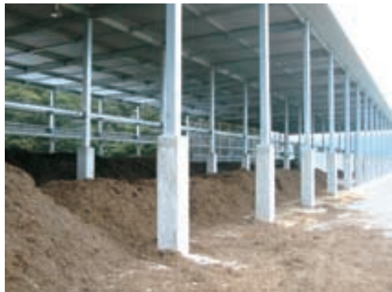
堆積式発酵槽 (手前は剪定チップ)