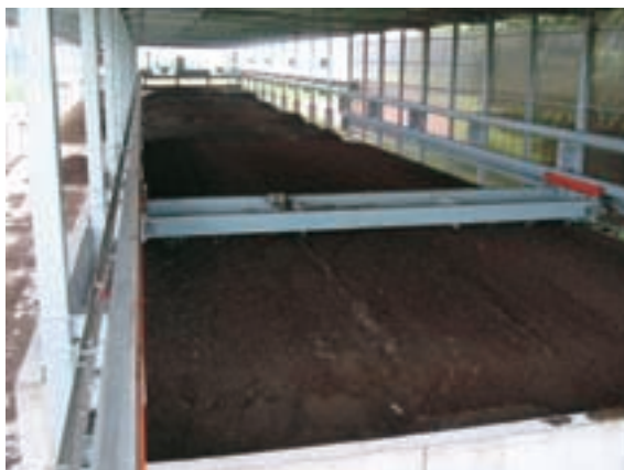
ロータリー式乾燥施設 (手前から奥へ攪拌搬送)