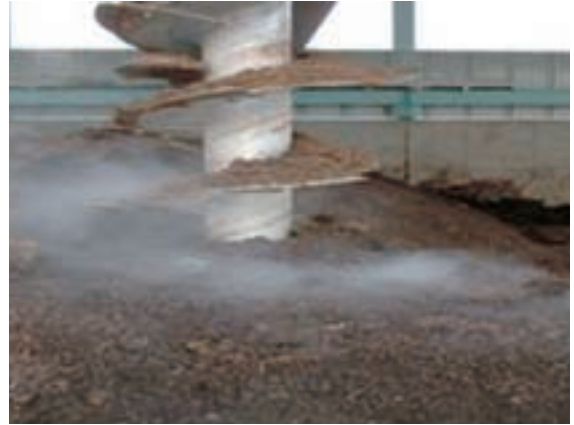
スクリーュー先端にエアーノズルがあり粉碎しながら 酸素を注入発酵促進している