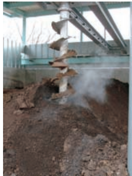
2月の寒い時期で温度 75 まで上げている（牛ふん）